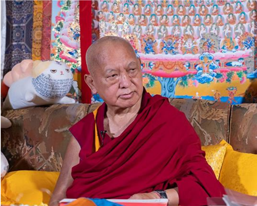
Lama Zopa Rimpoché impartiendo una enseñanza en línea, Monasterio de Kopan, Nepal, marzo de 2021.