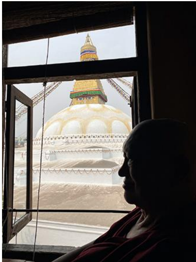
Lama Zopa Rinpoché con la estupa Boudhanath, Katmandú, Nepal, marzo de 2021.