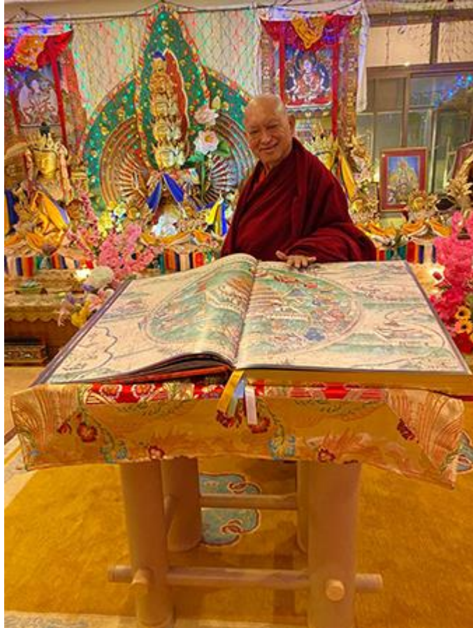
Lama Zopa Rimpoché con un maravilloso libro de arte, Murales del Tíbet, que se le ofreció recientemente, Monasterio de Kopan, Nepal, febrero de 2021.