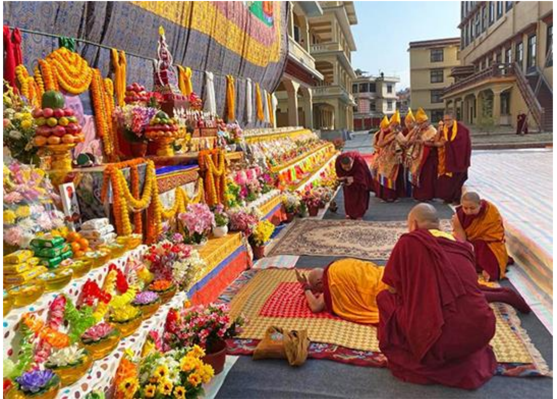
Lama Zopa Rimpoché postrado ante el gigante Guru Rimpoché thangka durante el Guru bumtsok en Khachoe Ghakyil Nunnery, enero de 2020