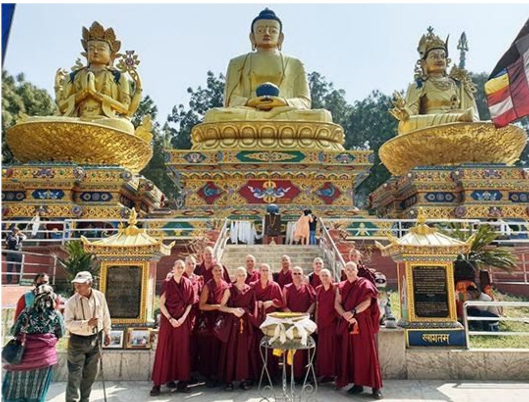
Monjes de Nalanda durante su visita a Swayambhunath, Nepal, marzo de 2020.

Fotografía de los monjes del monasterio de Nalanda.