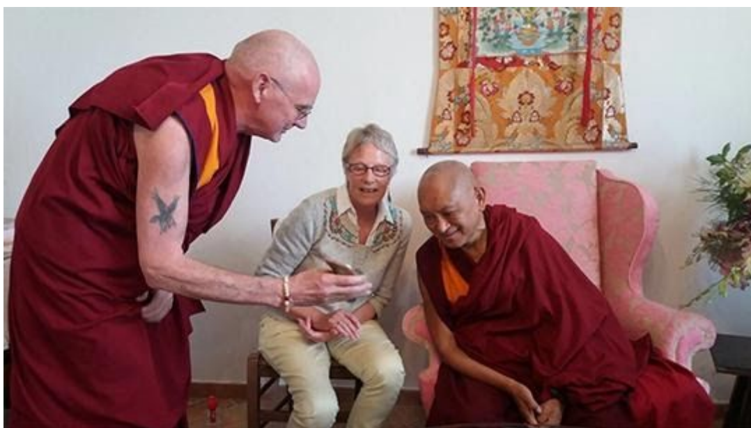
Lama Zopa Rimpoché con Ven. Roger Kunsang y el facilitador registrado FSS Wendy Ridley mirando la aplicación DIT, Italia, octubre de 2017.

Creamos la Descripción del trabajo interior (DTI) como una ayuda práctica para desarrollar la atención plena sobre nuestros pensamientos, habla y acciones, de modo que una mayor conciencia de nuestros hábitos mentales permitan realizar cambios reales y positivos al convertirse en un "profesional interior" según lo aconsejado por Lama Zopa Rimpoché.