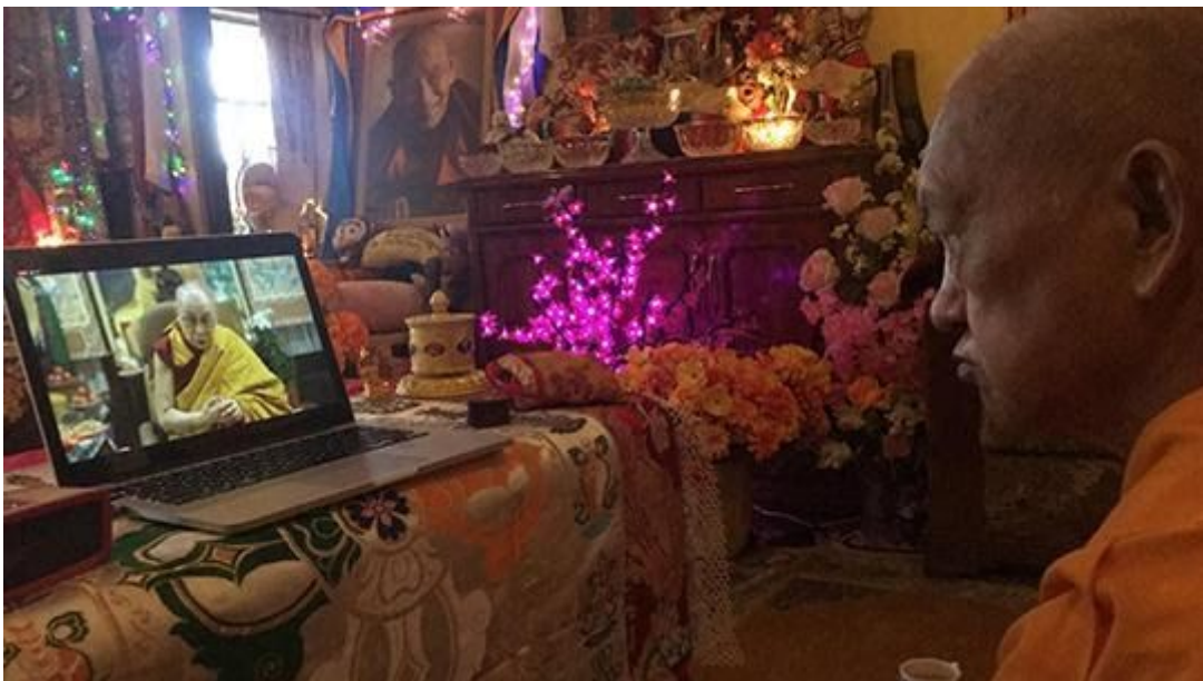
Lama Zopa Rimpoché tomando votos de bodhisattva de Su Santidad el Dalai Lama en línea en Saka Dawa, Monasterio Kopan, Nepal, junio de 2020.