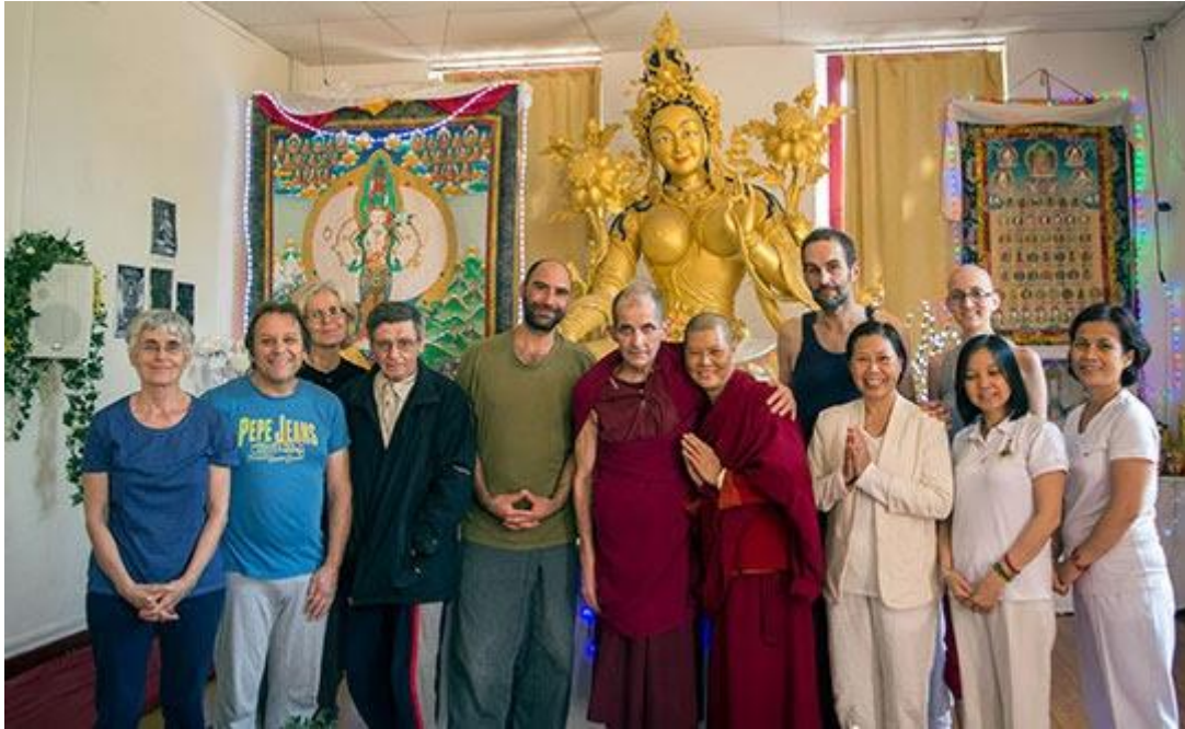
Participantes en el 108 retiro de Nuyng Nä este año.

Por favor, únete a nosotros en la apreciación de la realización de siete rondas de 108 retiros nuyng nä en el Instituto Vajra Yogini (IVY), Francia. Lama Zopa Rimpoché esponsorizó diez personas con comida y alojamiento en cada una de las rondas de estos 108 retiros nyung nä en IVY. El IVY ha aportado su apoyo así como amables donantes privados.