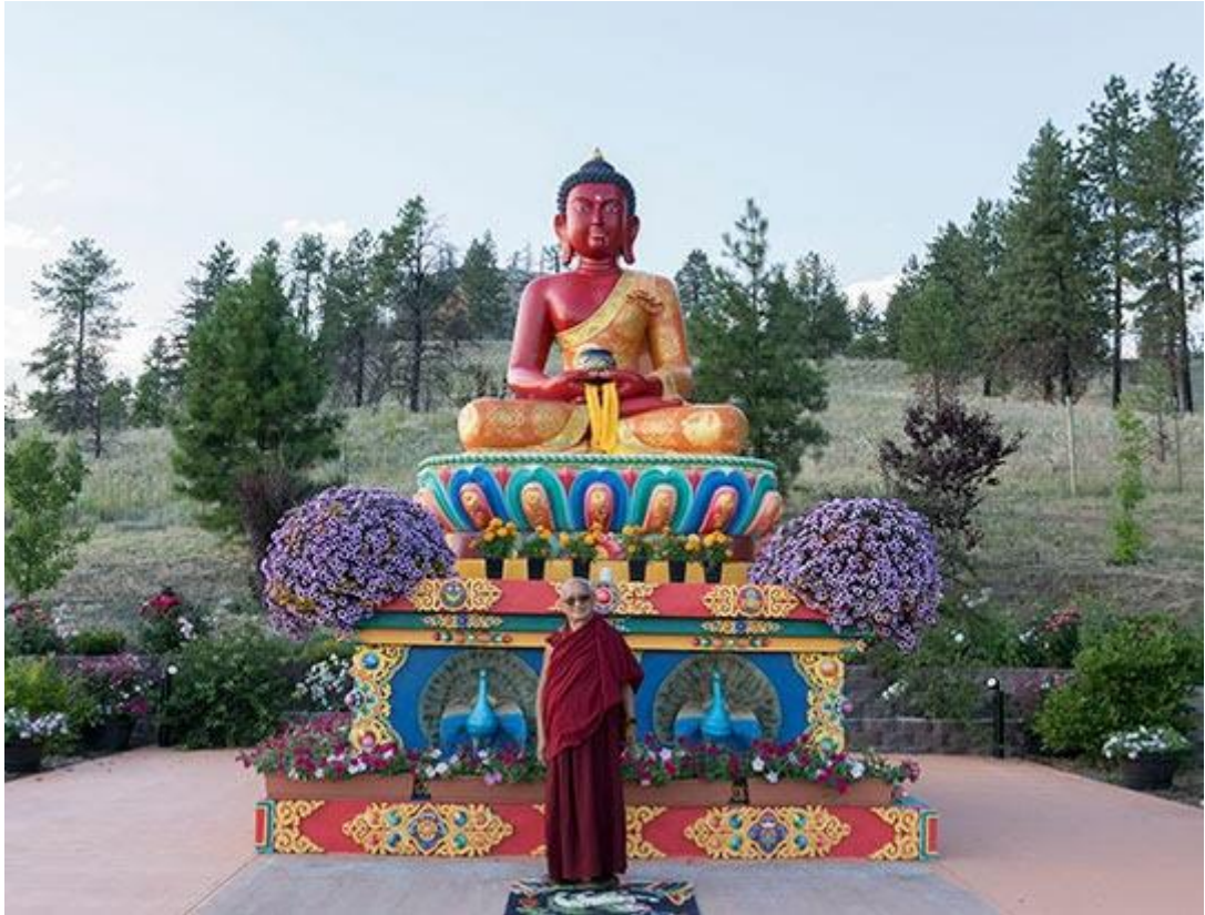
Lama Zopa Rimpoché delante de la estatua de Amitaba, Estado de Washington, julio 2018.