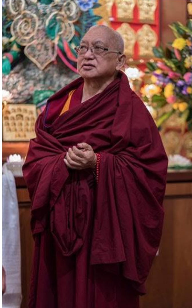
Lama Zopa Rinpoche durante la celebración de Saka Dawa, instituto Chenrezig, Australia, mayo 2018.